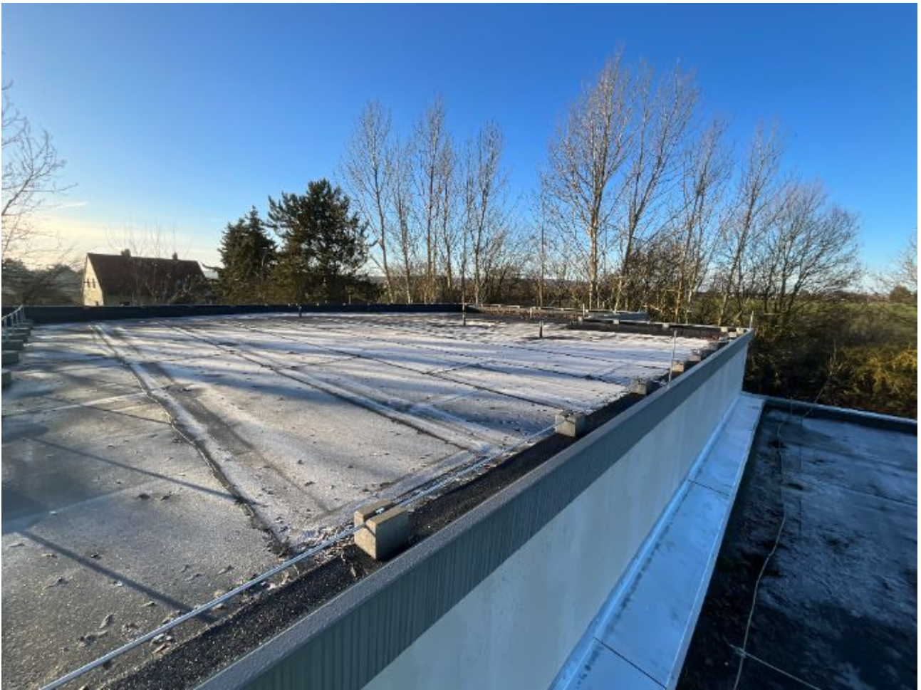
Platz für Umrichter